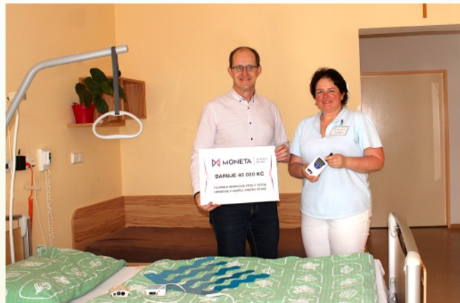
Pořízení dvou snímacích podložek bylo umožněno díky finančnímu daru firmy Moneta Money Bank.

V tomto roce se do Hospice Anežky České podařilo pro zkvalitnění poskytovaných služeb získat dvojici nového vybavení - senzor opuštění lůžka a mobilní ultrazvuk. Senzor opuštění lůžka je plochá plastová podložka, která se umísťuje pod matraci. Jeho citlivost je tak vysoká, že přes několik vrstev materiálu zachytí i ten nejnepatrnější pohyb, jako je tlukot srdce či dýchání. Pokud senzor takový pohyb nezaregistruje, ošetřující personál bude upozorněn zvukovým signálem. Tuto podložku využijeme především u pacientů se ztíženými komunikačními možnostmi, přístroj však pomůže i se zjištěním a urychlením poskytnutí pomoci při epileptických záchvatech. Mobilní ultrazvuk je dalším přístrojem, který pomůže jak pacientům lůžkového hospice, tak i pacientům mobilního hospice v jejich domácnostech. Lékařům umožní přesněji určit diagnózu a lépe nastavit další léčbu. Pro tento účel byl získán grant ministerstva zdravotnictví a také mu je věnován výtěžek loňského Běhu pro hospic.